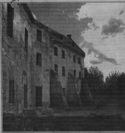
Стіни клеванської твердині пам'ятають багато трагедій...

Підготував В. ПАРФЕНЮК. Закінчення. Початок на 1 стор.