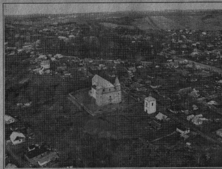
З висоти пташиного польоту.

демурували знищені частини огорожі, вставили нові вікна, покращили фундаменти, а коли довелося навколо костелу прибирати