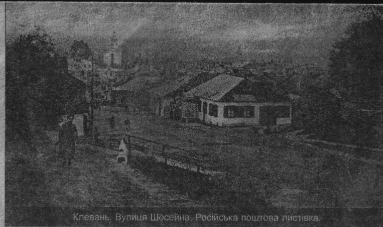
Клевань. Вулиця Шосейна. Російська поштова листівка.

На вул. Міцкевича, недалеко від крутого плато, знаходиться ранньобароковий Благовіщенський костел, який непогано видно з траси. Засновник храму Єжи Чарторійський, отримавши освіту у віленських єзуїтів, перший з цього княжого