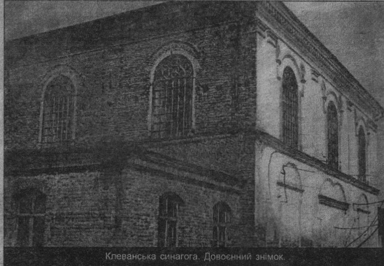
Клеваньська синагога. Довоєнний знімок.

У 1860р. Чарторійські продали свої тутешні маєтки російському царю Олександру II. У палаці магнатів розташувався уряд волинсь-