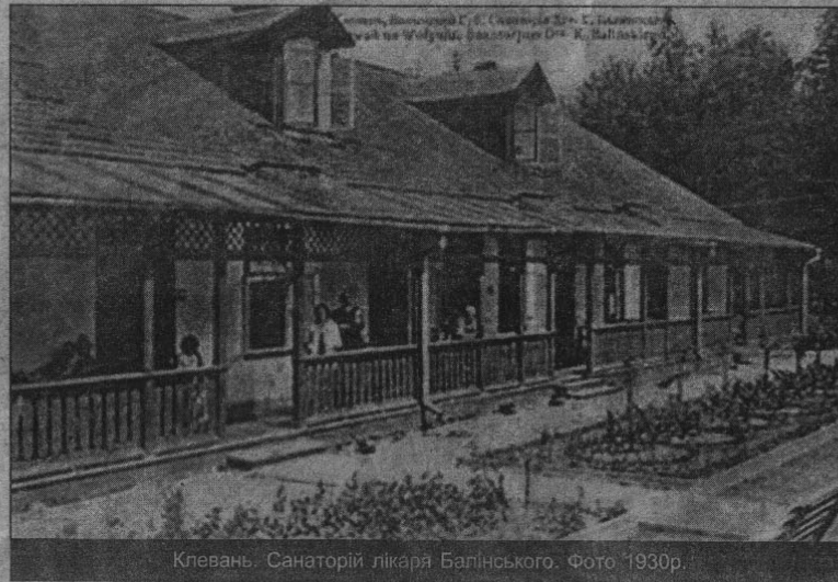
Клевань. Санаторій лікаря Балінського. Фото 1930р.

За інформацією порталу mycastles.narod.ru .