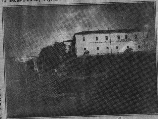
На фото (вгорі): вулиця Шоссеїна в Клевані. Поч. 20 століття. Давнішні знімки Клеванського замку.

математика, в статті І.Кулжинського ми не віднайдемо ніяких подробиць. Видно, було воно таким, як і скрізь на той час в Російській імперії. Гадаємо, нашим читачем буде цікаво, як була організована шкільна освіта в першій половині 19 століття. У принципі, мало що в цій організації змінилося впритул до Жовтневої революції 1917 року.