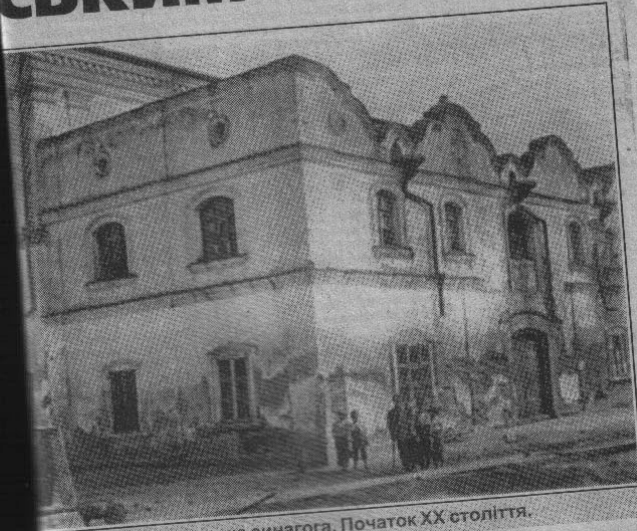
Клеванська синагога. Початок ХХ століття.