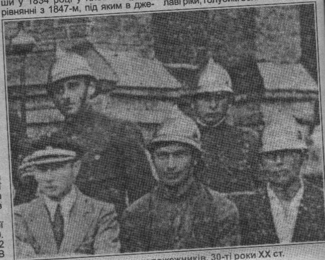
Група клеванських пожежників. 30-ті роки ХХ ст.

Клевань лежав майже чи не на півдорозі на поштовому шляху (тракті, зейдси і назва нашої газети) з повітового міста Луцька у повітове Рівне. Подорожний, коли їхав з Луцька у напрямку Рівного, під'їжджаючи до Клеваня, міг угледіти приблизно таку ж картину, як і зараз. Пагорб, що потопав у зелені, на якому виділяються праворуч від тракту замок Чарторийських, а ліворуч – католицький костел. По обидва боки дороги біля Клеваня простиралася широка заплава річки Стубла (у 19 столітті цю річку в літературі іменували не інакше, як «Стубель»). За нею, ліворуч, вдалині білим «зрізаним» горбом у вічі кидались крєйдяні поклади, поруч з якими, майже загублюючись у заплаві ріки, голубим величезним оком