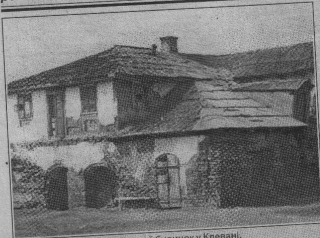
Єврейський будинок у Клевані.