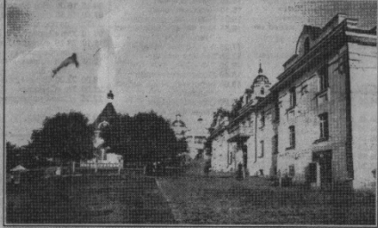
Лаврский готель і каплиця навпроти нього. 1900 р.

Любовятную и глубоко назидательную картину представляла собой так называемая Божья гора, лежащая как раз при дороге,