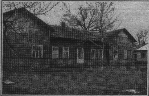
Стара Клеванська ДЮСШ.

Однак дехто із сучасних шукачів скарбів, все-таки мав інформацію про давні комунікації