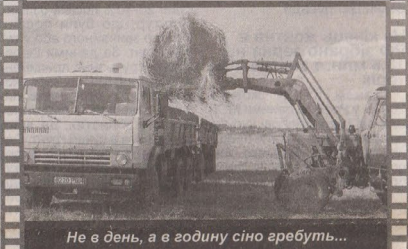
Не в день, а в годину сіно гребуть...