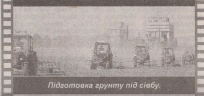
Підготовка ґрунту під сівбу.