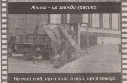
Не той хліб, що в полі, а той, що в коморі.

сприяє нам у закупівлі невелик. Я згідний з позицією міністра С.М.Рижук, що державну підтримку мають відчувати крупні виробники сільськогосподарської продукції, ті, які називаються, наплав, від яких за короткий термін можна досягнути реальної віддачі.