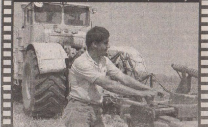
K-700 — надійний «кінь»!