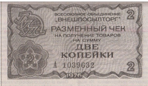
За такі чеки в Союзі «афганці» могли придбати дефіцит.

— Нам чеки давали, на які можна потім було щось придбати в радянських «Берізках». Правда солдати і сержанти отримували їх не так і багато. А на місці сигарети і зубну пасту, інший дріб'язок продавали з автолавкою. Саме в Афганістані я призначався до палатки, на жаль, димило по сьогоднішній