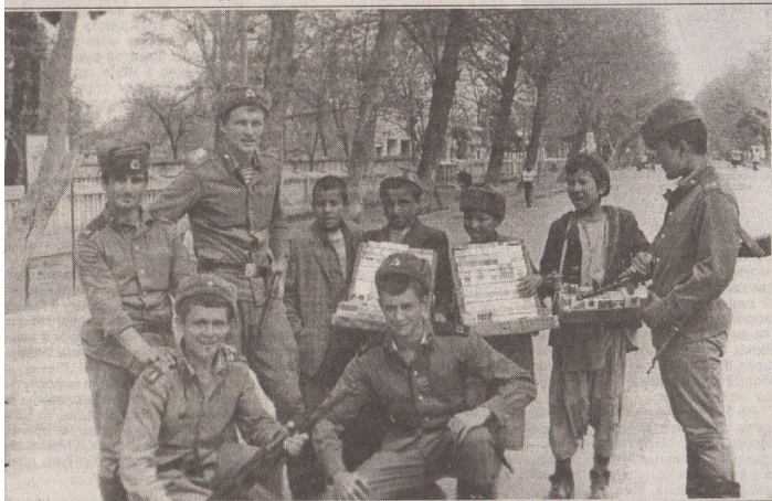
На вулиці афганського міста Кундуз. 1980р.

акт в політичній та військовій. Для нас би мова про Афганістан. А ми, так велить закон.