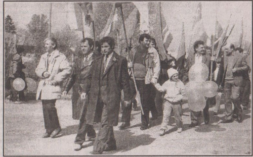
Хай живе 1 Травня! Колона будівельників на демонстрації.