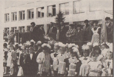
Перший дзвоник – 91.