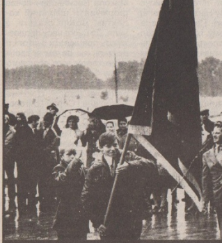
Під час відкриття школи. 1 вересня 1978 року.