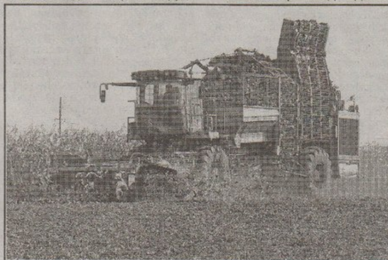
Фото автора та С.ДЕЛІДОНА.