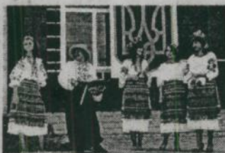
Відзначення Дня Незалежності в селі Дядьковичі