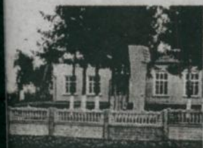
Будинок культури, село Милостів