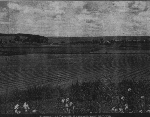
Круговид на Голішів зі сморжівських пагорбів.

міхавачись пропонує вона. І в хаті, де все якимось загадковим спокоєм і затишком, тихенько льється пісня про Україну, про її гріну поневолену долю. А слова в пісні — то вистраждана серце українського народу, що бореться за волю. Бореться з надією, що більше не буде коватися в лещі, а Київ стане серцем нової, вільної держави. ... ходили по лісі — Більше не будем, П'демо на Київ — напевно здобудем. Лариса РОКУНЬ.