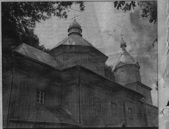
Православна церква в Голишіві.

я був солістом, співав також і в церковному хорі. Село наше ожило, славилося своєю художньою творчістю. Була в мене дівчина, що й на фронт мене випровад-