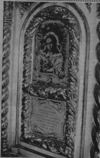
Список ікони «Възсканіе погыбшых» в оригінальній фольговій ризи, що оновилася вогнем.

Ікона перебувала в сільському храмі під Києвом на престольний празник Покрови Пресвятої Богородиці. Все ніч перед нею служили молебні та акафісти. В цей час однієї жінки дуже захворів син. У хлопчика піднялася висока температура і почалися судороги. Мати з дитиною прибігла в церкву о третій годині ночі. Святийня прикляк дитину до ікони «Възсканіе погыбшых». Потім матию догравил матір з ситком у лікарню. «Навіщо ви привезли здорову дитину?» — здивувалися медики. Температу-