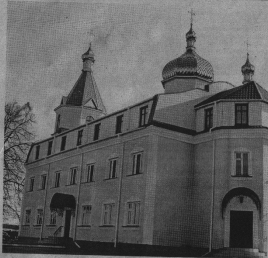
Храм в честь ікони «Възсканіе погыбшых».

знаходилася саме тут. Проте у часи воєнного агресивізму, аби менше людські знайомих про чудотворний образ та аби зменшився потік наломників, влада дала хитру вказівку — переіменувати церкву на честь Різдва Пресвятої Богородиці. Нині це — не монастирська, а приходська церква села Білівськ Хутори.