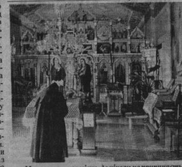
Монастир — це місце, де ніколи не припиняється