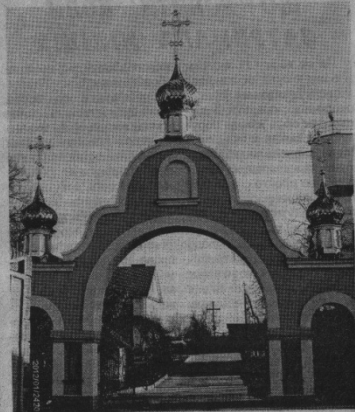
Ворота Білівського Різдово-Богородичного жіночого монастиря.

ній пражник. Кілька разів ікону намагалися одягнути у коштовності. Але з того нічого не вийшло. Кажуть, ще у 1928 році на друзки розлетілася корона, якою її було увінчано на честь перших зільєнь. А вже у наш час владика Рівненський і Острозький Варфоломій, побачивши ікону в дешевій фользі, вирішив справити для Божої Матері коштовні ризи. Залія цього владика особисто поїхав у Софріно, що під Москвою. Він розповів прийомниці, якими мають бути ці ризи. Але коли приїхав забрати замовлення, виявилось, що цього документу ніхто не бачив, а жінка, котра його приймала і яку описав владика, на підприємстві ніколи не працювала. Тоді, щоб зрозуміти волю Богоматері, вирішили зробити так: у мітру поклали два аркушки паперу, на яких було написано дві пропозиції. Перша — про виготовлення коштовних риз, друга — проти. Після молитви з мітри тричі виймали аркушки з пропозиціями і тричі Діва