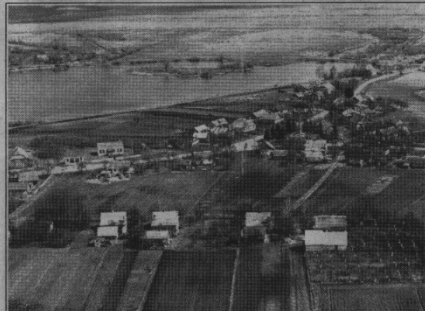
Частина села Голишів з видом на ставок з висоти пташиного польоту.