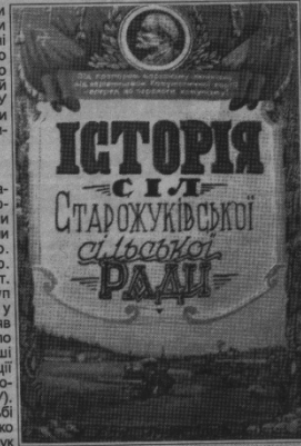
Титульна сторінка праці.