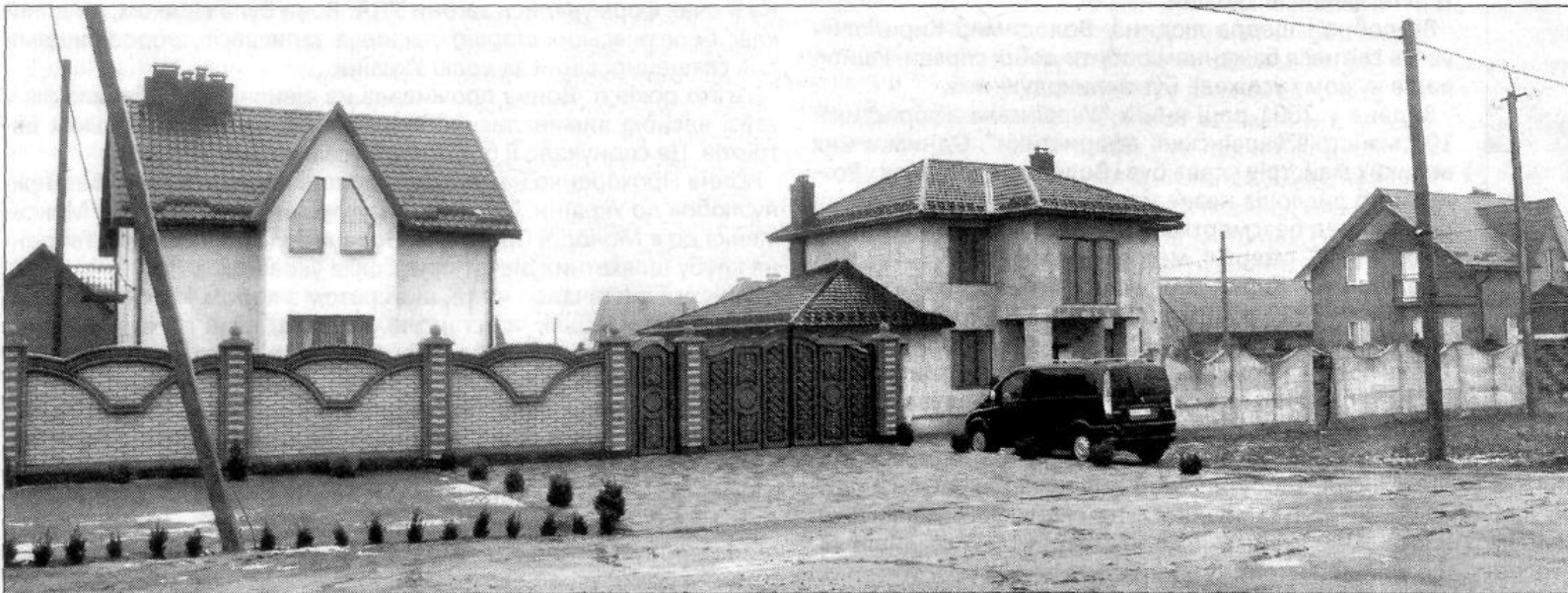
Ось такі сучасні просторі будинки зводять у новому мікрорайоні села.