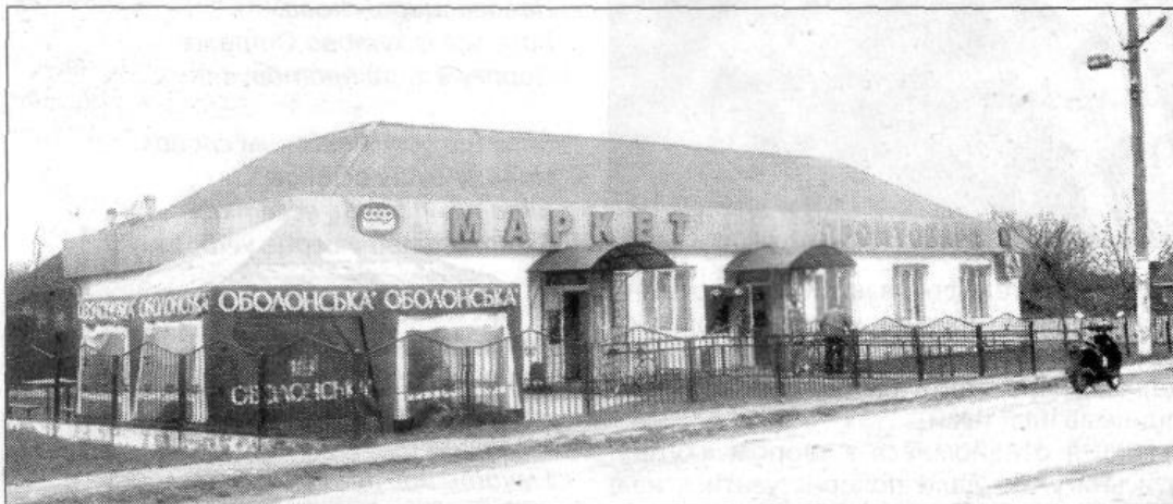
Приміщення торгового комплексу райСТ.