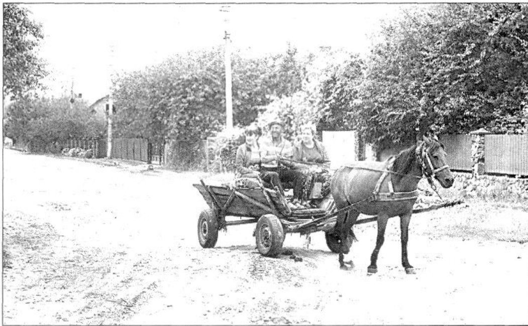
На одній із сільських вулиць.

З плином часу в цьому поселенні знаходили собі притулок жителі Моквина, Бистрич, Холопів, Лінчина, Михалина, Балашівки та інших сіл. Це, зокрема, підтверджують прізвища теперішніх більчан – Данильчуків, Боровців, Синюків, Натяжків, Хилюків та ін.