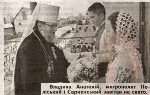
Владика Анатолій, митрополит Поліський і Сарненський завітав на свято.

розбіглися в різні боки. Упродовж 1952-1971 рр. трудився на духовній ниві в немовицькому храмі Анатолій