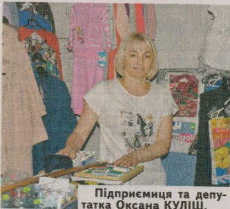
Підприємця та депутатка Оксана КУЛІШ.