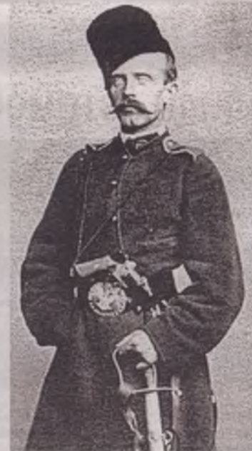
Тадеуш Єжи Стецький

Похований письменник та вчений в селі Ставище Млинівського району.