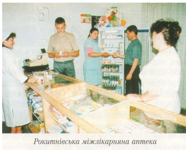
Рокитнівська міжлікарняна аптека

У 2005 році Рокитнівська ЦРЛ відзначатиме своє 65-річчя. Колектив лікарні пережив війну, відбудову, голод, перебудову, розпад СРСР, виконуючи гідно найвідповідальніше завдання - рятуючи людські життя.