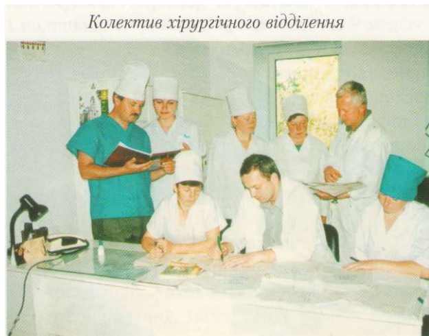
Колектив хірургічного відділення