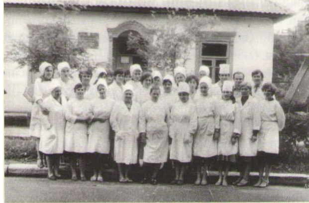
Колектив поліклініки Рокитнівської ЦРЛ. Фото 1983 року

Історія розвитку медицини в районі тісно пов'язана з розвитком самого селища Рокитне. Виникнення селища Рокитне (до 1922 року - Охотникове) припадає на час промислового пожвавлення 80-х років XIX століття. В 1896 році розпочато будівництво склозаводу. У той час при заводі була лікарня, в якій працював один лише лікар.