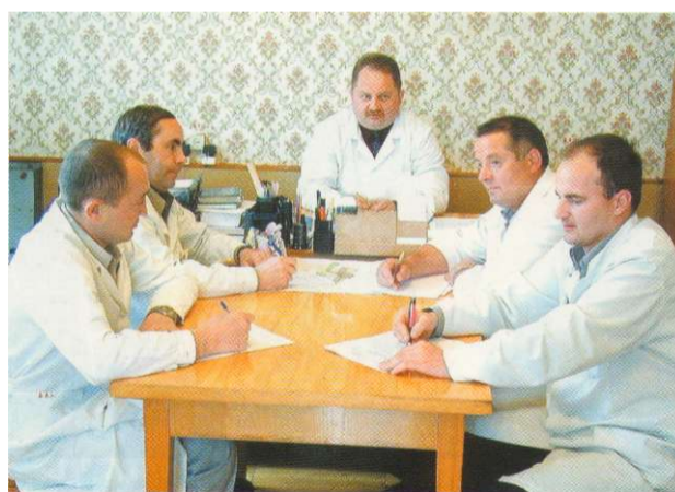
Нарада у головного лікаря