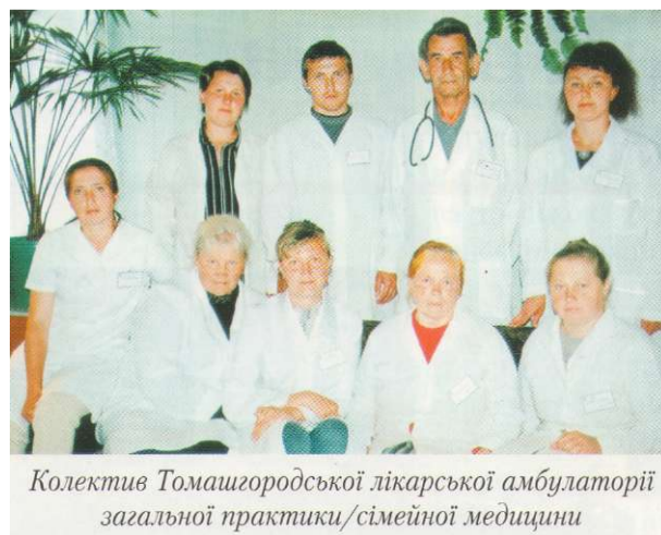
Колектив Томашигородської лікарської амбулаторії загальної практики/сімейної медицини