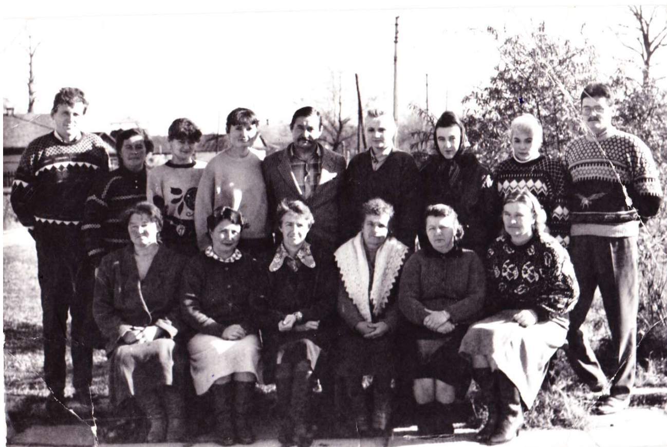
Вчительський колектив школи (1993 рік)