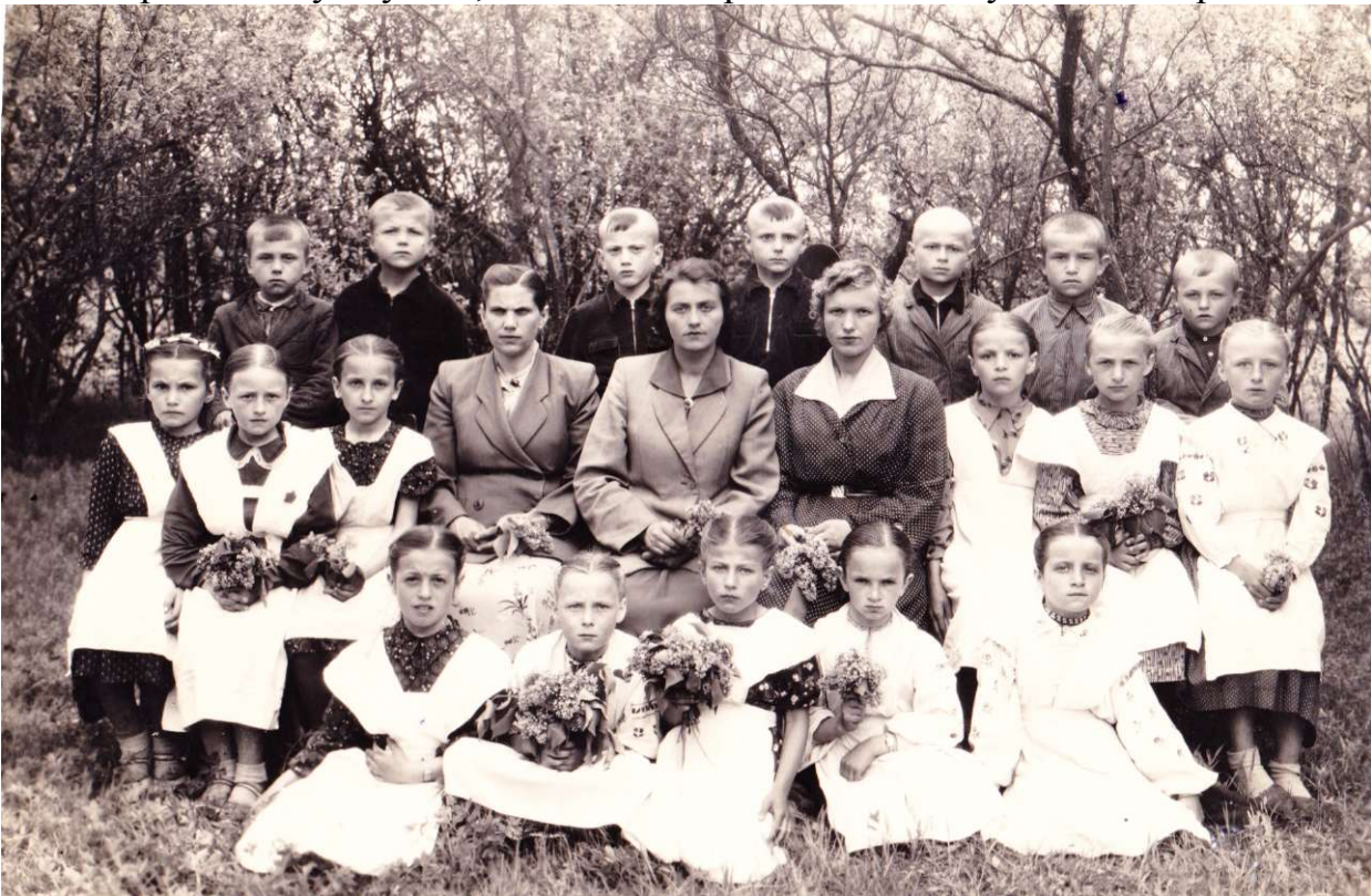
Перший випуск новозбудованої школи – 1967 рік.