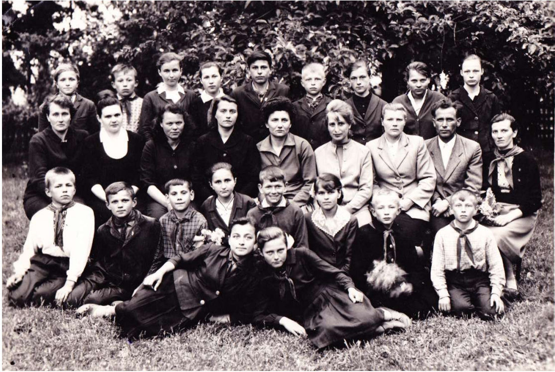
1966 рік (6 клас та вчителі школи)