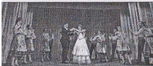
Мистецькі подарунки від гостей фестивалю