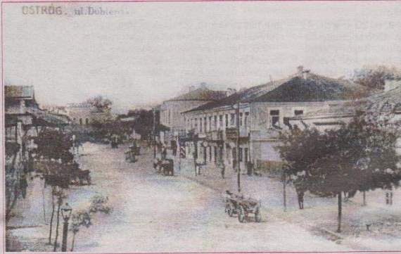
верхньому фото). На ньому зображено 3 будинки, які колись мали номери 25, 27 і 29. У тих будинках колись жили