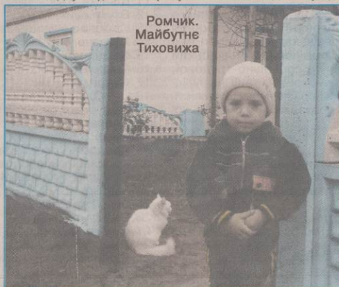
Ромчик. Майбутнє Тиховижа

відвідували спочатку Борівську ЗОШ І-ІІІ ступенів, а нині перевелись до Кухтиськівської школи. Тож, виходить, що ці діти по дорозі до знань уже освоюють 4-ту школу. Й звісно, що в декого – це не надто позитивно позначається на самих знаннях. А враховуючи, в який спосіб школярі дістаються до Острівська (славнозвісна "кукушка", яка, збиваючись з графіка, в Тиховиж прибуває і о десятій, і об одинадцятій, о 12 години, а часом і взагалі відсутня), то стає зрозумілим