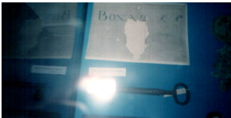
Фото однієї із грамот королеви Бони

У пам'яті про неї на Піщині залишився канал Бони, колодязь і т.д.