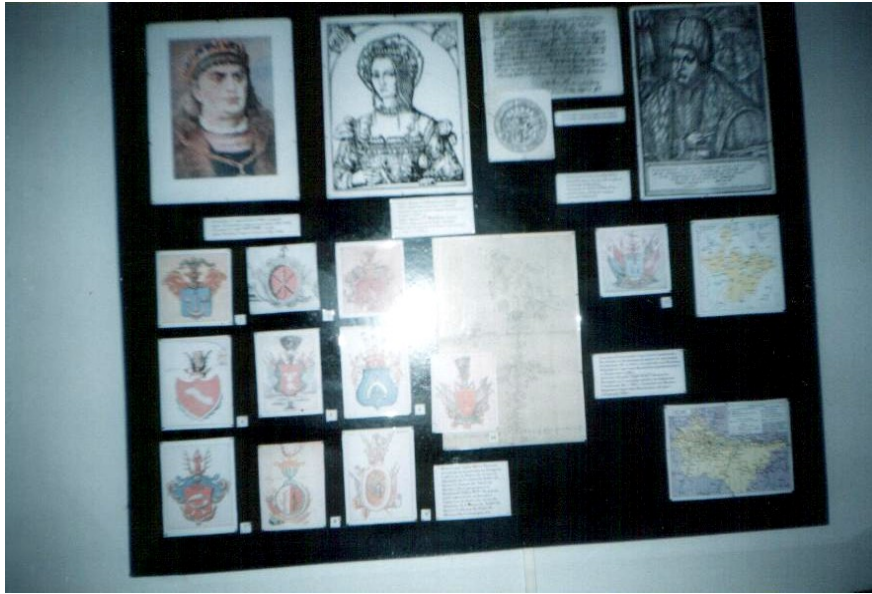
Експозиція музею, присвячена королеві Боні