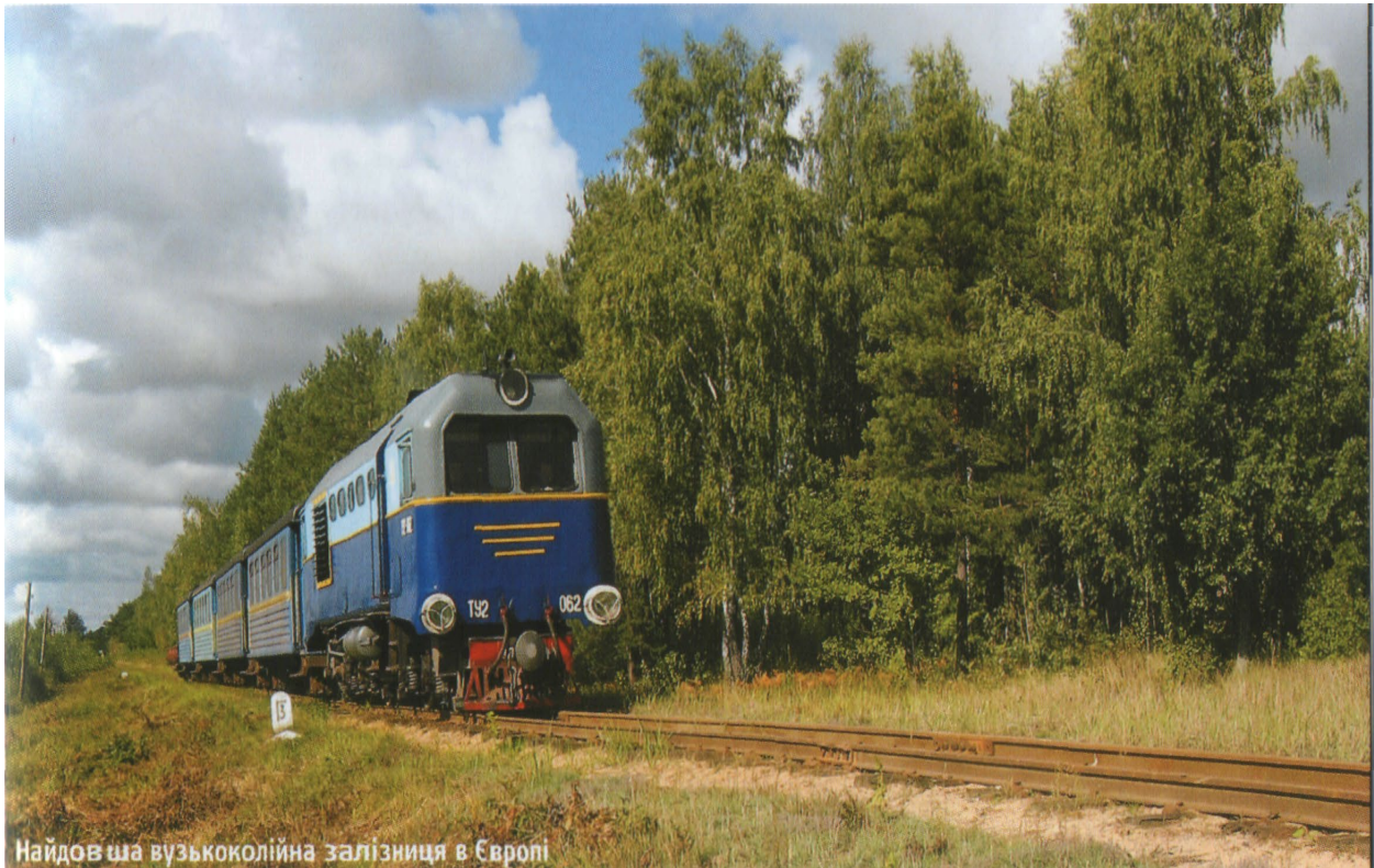
Найдовша вузькоколійна залізниця в Європі

Чудовою можливістю неквапливо насолодитися усією красою поліської пейзажу є подорож єдиною найдовшою вузькоколійною залізницею в Європі , що протяглася від станції Антонівка Володимирецького району до смт. Зарічне. Залізницю довжиною 106 км побудували місцеві купці в 1905 р. Потяг зупиняється на 5 станціях та 15 стаціонарних зупинках, перетинає унікальний залізничний дерев'яний міст через р. Стир поблизу села Млинок.