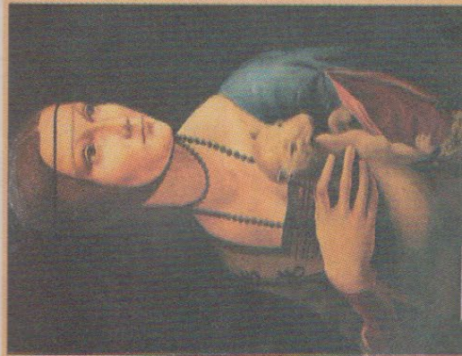
Да Вінчі "Дама з горностаєм"