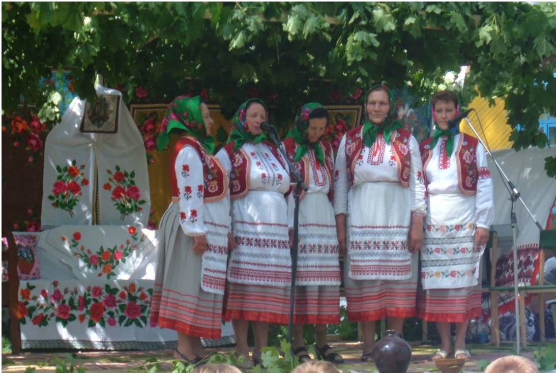
Народний аматорський фольклорний колектив с. Сенчиці, який продовжує і примножує пісенну спадщину Євдокії Хоружої