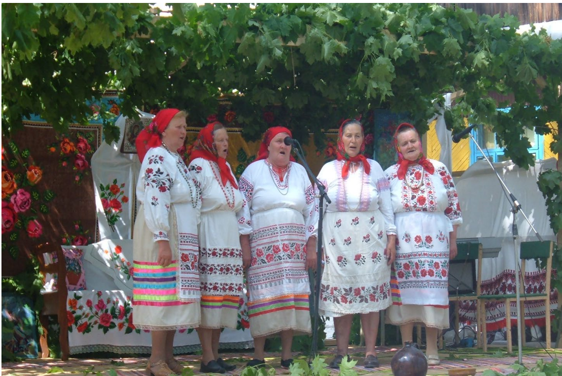
Фольклорний гурт с. Локниці – переможець в районному святі «З народної криниці», нагороджений премією ім. Євдокії Хоружої в 2008 році