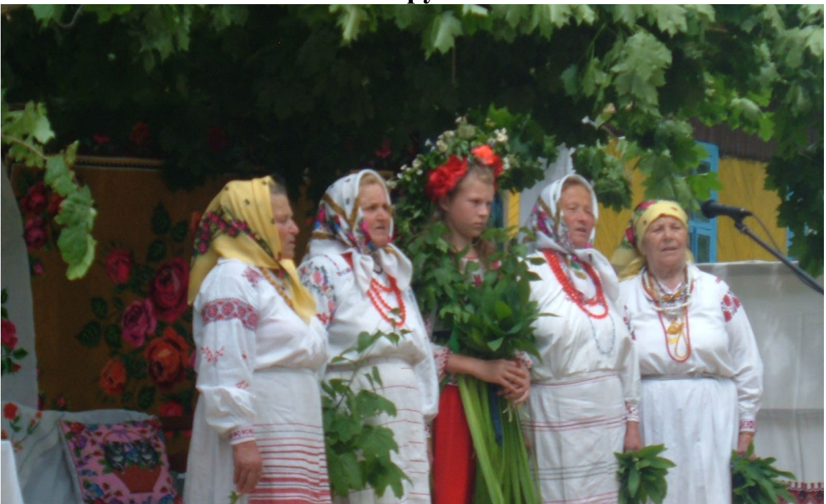
Далеко за межами нашого району відомий народний аматорський фольклорний колектив с. Старі Коні, який зберіг традицію «Водіння Куста»