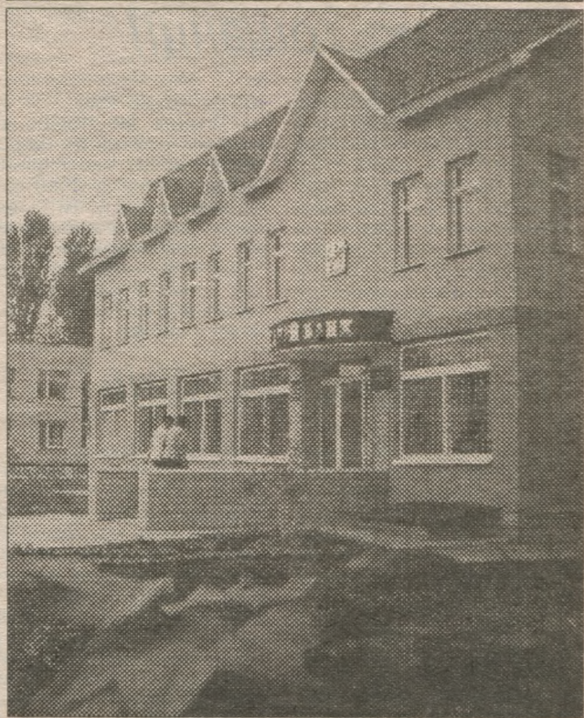
Окрасою Гощі нещодавно стали приміщення районного центру зайнятості та районного відділення Ощадного банку.