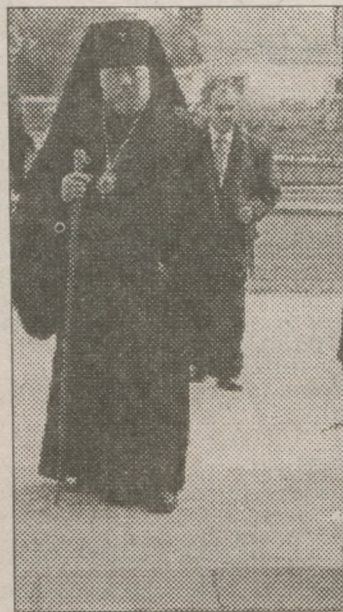
Ми у вічному боргу переваги. Квіти від шанованих

Народний депутат України П. Г. Сулковський охарактеризував політичну ситуацію в державі, поздоровив гощанців з ювілеєм, а також повідомив про те, що виконане замовлення інваліда першої групи Івана Ткачука і йому доставлено самохідну інвалідну коляску. А Державний секретар Кабінету Міністрів України В. Г. Яцуба оголосив вітання Президента України Л. Д. Кучми учасникам урочистостей з нагоди 850-річчя селища Гоща: «Сердечно вітаю жителів Гощі із 850-річчям від дня з'ясування. Історія цього волинського селища тісно пов'язана зі становленням нашої державності, формуванням духовних цінностей українського народу. Нехай славні традиції минулих знаходять гідне продовження у сьогодні, сприяючи згуртуванню мешканців Погориння навколо ідеалів добра і справедливості, нагадують про відповідальність перед Богом,