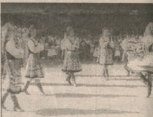
На площі Незалежності святковий ко