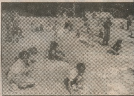
Чий малюнок кращій? А це вже визнач

Д ЕСЯТЬ останніх років ми пройшли під знаком незалежності, як самостійна, суверенна держава. Непростим був цей шлях, вибоїстим, у злетах і падіннях. Але Україна утвердилася на світовій арені. І тому свято незалежності кожен з нас сприймає як своє особисте.