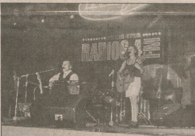
На сцені — гості з Рівного.