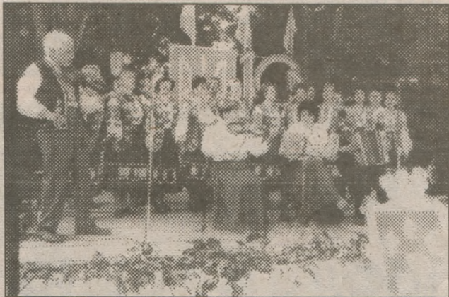
Тучинські артисти ще раз підтвердили, що вони справжні лауреати.