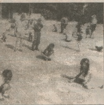
ий? А це вже визначить журі.

мовчання вшанували пам'ять загиблих за волю України.