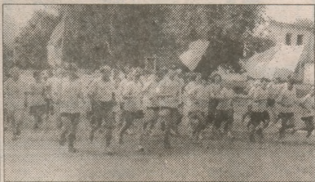
Спортсмени Рівного на вулицях Гошчі.