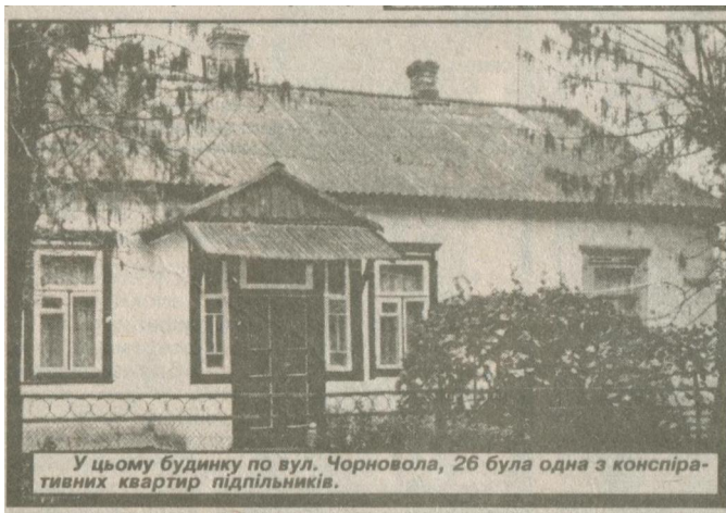
У цьому будинку по вул. Чорновола, 26 була одна з конспіративних квартир підпільників.