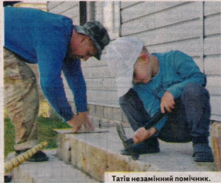
Татів незамінний помічник.