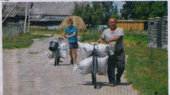
Повертаючись зі жнив.

к професію маляра-штукатур в Сарненському ВПУ-22. На рахунку