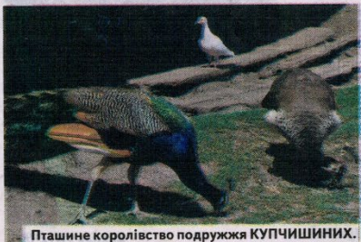
Пташине королівство подружжя КУПЧИШИНИХ.