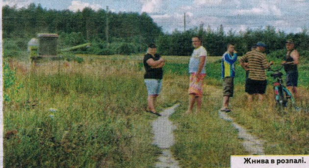
Жнива в розпалі.