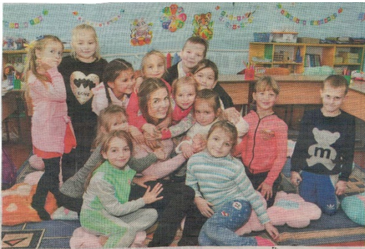
Як живеш, так і вчишся?