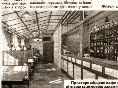
Просторе місцеве кафе з літньою та зимовою залами.