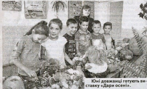
Юні доджанці готують виставку «Дари осені».

Першим місцем, куди навідалися, був ФАП. Зовні його приміщення нічим не відрізняється від звичайних сільських медзакладів, та всередині нагадує скоріше затишну квартиру: