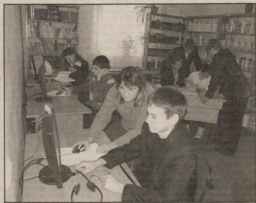
Завжди є чимало відвідувачів у Інтернет-залі Немовицької книгозбірни.

На сьогоднішній день Клевівська масова бібліотека є сучасною інформаційною установою, куди можна прийти й отримати потрібну для себе інформацію. Нині в бібліотеці працює 3 комп'ютери, 2 принтери, сканер. Безкоштовні Інтернет-послуги надають найрозноманітніші запити читачів у інформації, в тому числі й на ту, якої немає в бібліотеці. А питання, з якими звертаються користувачі, різноманітні: від типових, простих — до найскладніших. Це — перегляд пол-