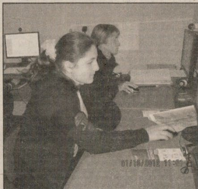
Є що почерпнути в Костянтинівській ПШБ і педагогам, і учням...

завідуюча відділом автоматизації бібліотечних процесів Сарненської центральної районної бібліотеки.