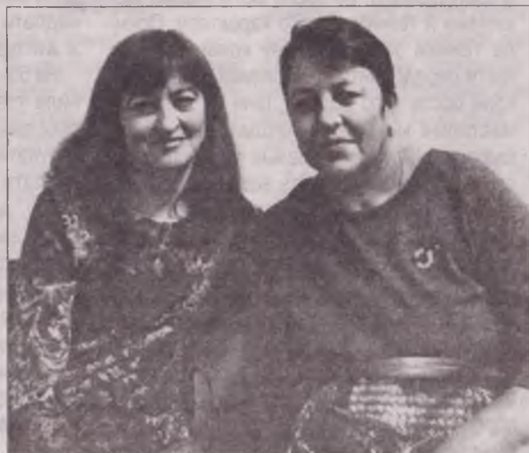
Нинішні представники Десницьких після несподіваної зустрічі на «Жди меня».

Оновлений два роки тому пам'ятник Іванові Десницькому біля собору в Луцьку – як добра пам'ять про славу волинську родину.