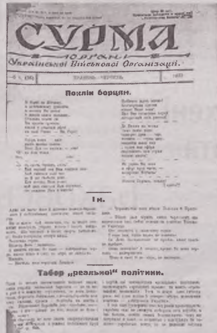
Примірник забороненого журналу «Сурма», який зберігається в науковій бібліотеці Державного архіву Рівненської області

під час богослужіння в Почаєві. Під час проведення служби повинен вивісити «національно-український транспарант» із дзвіниці Почаївської церкви»;