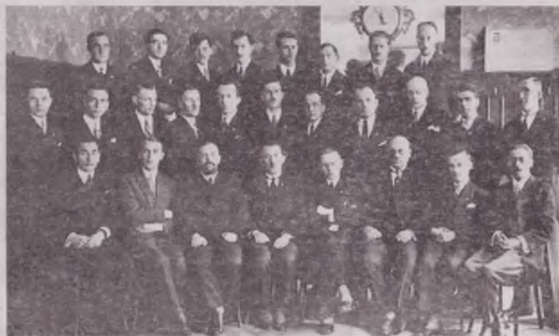
Перший конгрес українських націоналістів. Відень, 1929 рік

УНП, УСРП, УВО, УНДО, ВУО, ОУН — аббревіатури політичних партій та рухів, які діяли на території Волині у міжвоєнний період 1902-1939 рр. Усі вони тримали вектор на створення незалежної, самостійної держави на своїй землі. Хоч і по-різному підходили до реалізації поставлених