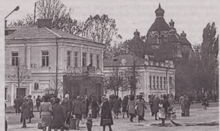
1967 рік. Ще добротний будинок архіву доживає останні дні перед знесенням

— Тоді запропонували розмістити там лише загальні фонди, а секретні документи — в будинку