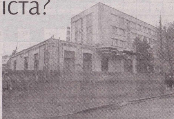
Будинок на вул. 16 Липня

В останній третині XIX — на початку XX ст. запрошували на українські землі (у Київ, в Одесу) німецьких архітекторів. Завдяки їм виникли нові стилі, в які німці в регіонах вносили індивідуальні «ноти». Відомий німецький зодчий В. Шретер став засновником т.зв. «цегляного» стилю, для якого була характерна заміна штукатурки