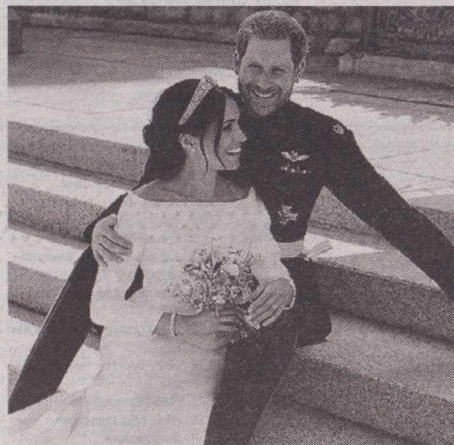
Весільні фото принца Гаррі та Меган Маркл, зроблені Алексі Любомирським

За публікацією Тетяни ЯЦЕЧКО-БЛАЖЕНКО, «Хроніки Любарта».