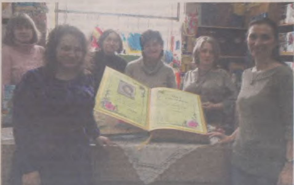
Відкрита збірка поезії вшити у книжкарні «Слово»

- Коли я кілька разів прочитала цей вірш - «Летять на землю груші, як з рога-ток», останні рядки якого лягли в основу назви збірки, я зрозуміла, що Ліна Ва-