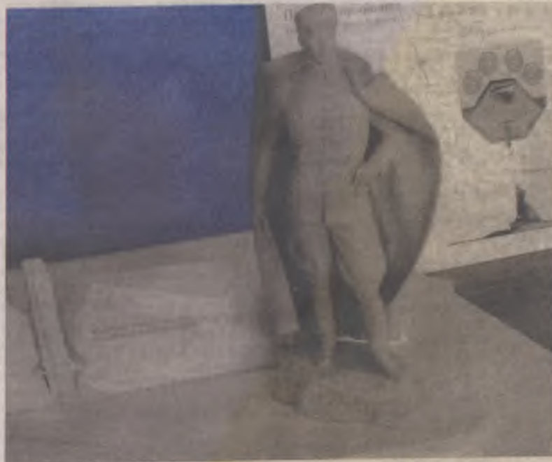
Один з проектів пам'ятника отаману Тарасу Бульби-Бортовцю у Рівному

Зокрема, зі стендів експозиції можна дізнатися про бойові дії між загонами УПА та частинами військ