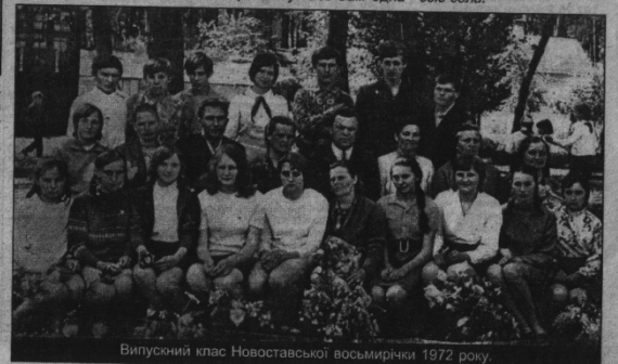
Випускний клас Новостваської восьмирічки 1972 року.

P.S. Минулого понеділка з ювілейної школи учнівський та педагогічний привітав народний депутат України В.А.Плютинський, який подарував цьому убовому закладу комплект гучномовної апаратури, а у своєму виступі на урочистій лінійці пригадав, як будувалася нова споруда школи, яка, безумовно, сьогодні так і залишається окрасою села.