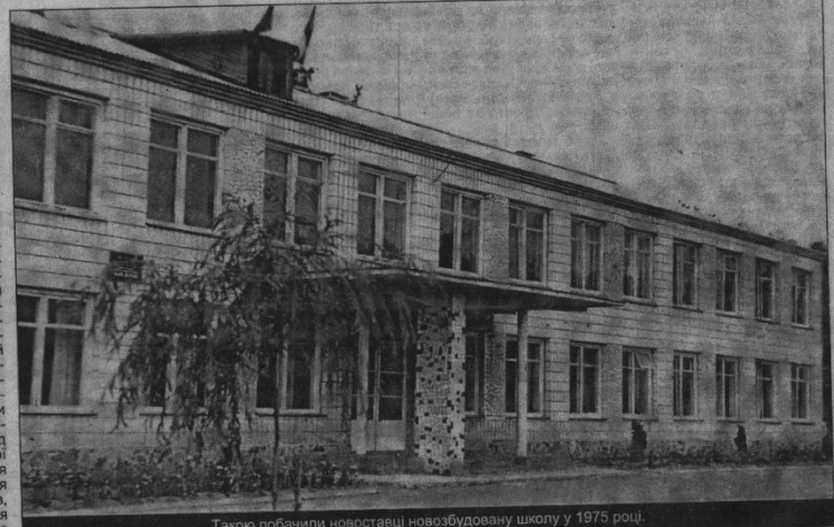
Такою побачили новоставці новозбудовану школу у 1975 році.

ла була побудована за кошти колгоспу, а держава вже потім повернула витрачені на будівництво гроші. Споруджували восьмирічку