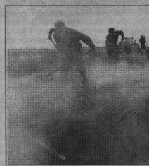
«Бригада зорянських асфальтувальників за роботою».

У 70-х – 80-х роках щороку зорянська дорожня дільниця виконувала обсяг робіт рівносильний прокладанню шести-десяти кілометрів асфальтної дороги шириною у 6 метрів. Так що, шановні зорянці, як і жителі навколишніх сіл, дякуйте їм за це!