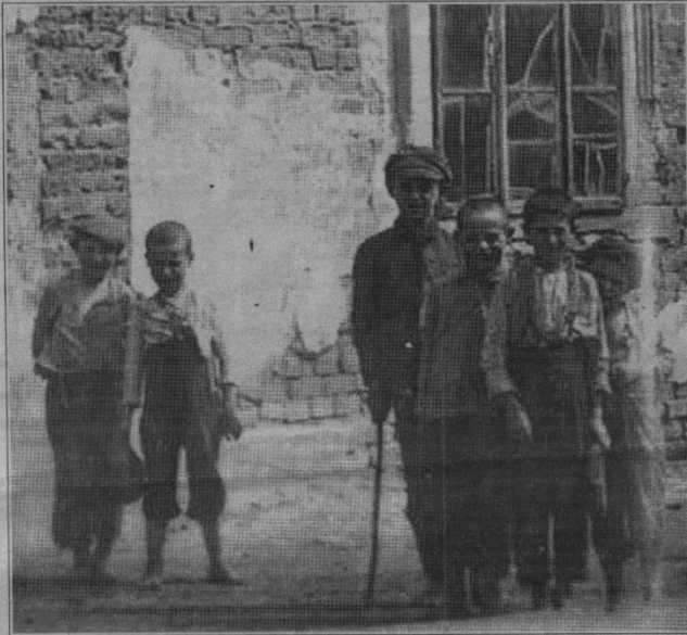
Кінець 30-х років. Діти клеванських євреїв біля синагоги.

Число жителів єврейської національності протягом 20-х — 30-х років у Клевані не було стабільним.