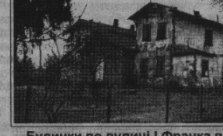
Будинки по вулиці І.Франка в Клевані, у яких знаходився притулок для дітей-сиріт. Сучасне фото.