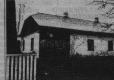
Будинки по вулиці І.Франка в Клевані, у яких знаходився притулок для дітей-сиріт. Сучасне фото.