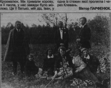
Молодичка «тусовка» на околиці Клеваня. 30-ті роки.