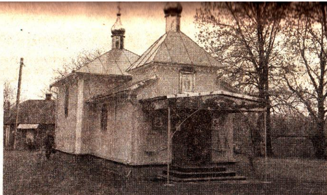
За часів Горбачова мешканці масиву за власні кошти вдалося відбудувати Свято-Покровську церкву.

– Війна для мешканців села минула швидко, лінія фронту пройшла через Золотіїв за тиждень, хоча бомби скидали на нас півтора року. По самому селі влучали чотири рази. Пам'ятаю, як