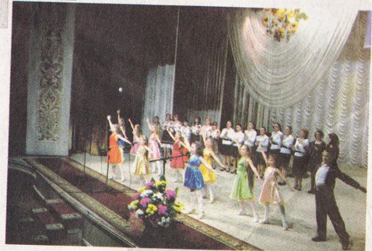
"Бурштинові нотки" зливаються в пісню! Гімн конкурсу всі учасники співали разом