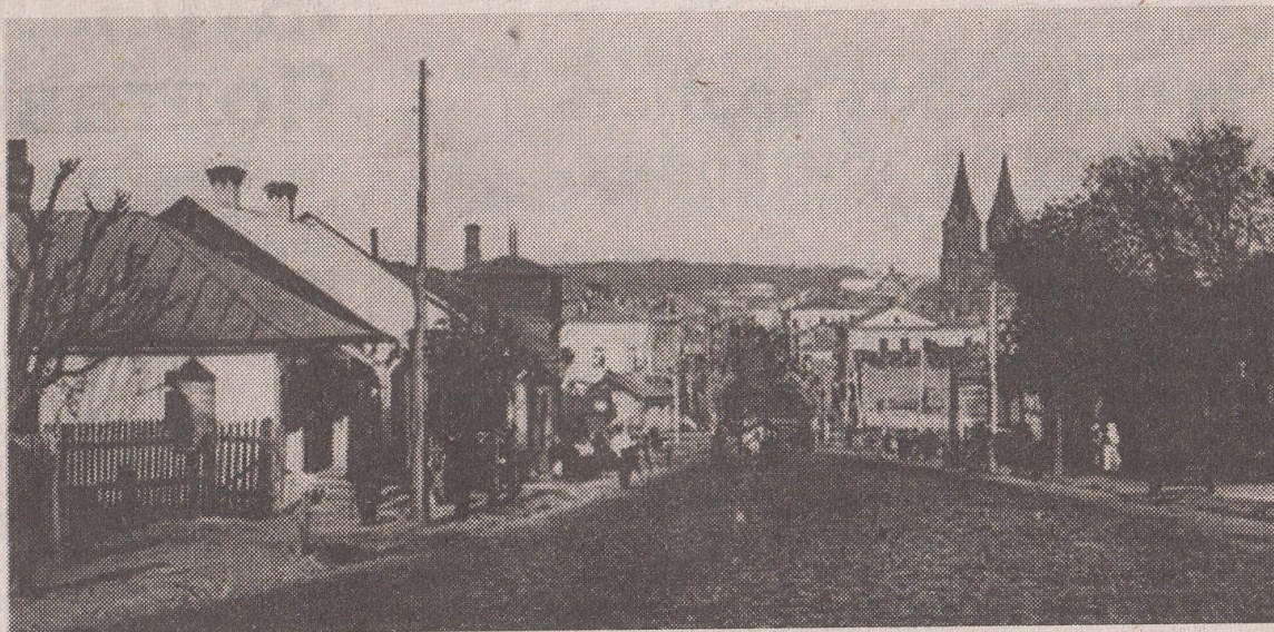
Загальний вигляд з "Волі". Початок ХХ століття

Що ж було "французького" на нинішній вулиці гетьмана Мазепи, що веде від Симона Петлюри в бік продовольчого ринку та вулиці Шевченка — сказати важко. Але факт залишається фактом: у минулому столітті ця вулиця, що згодом носила назву Комсомольської, чомусь гордо іменувалась Французькою!