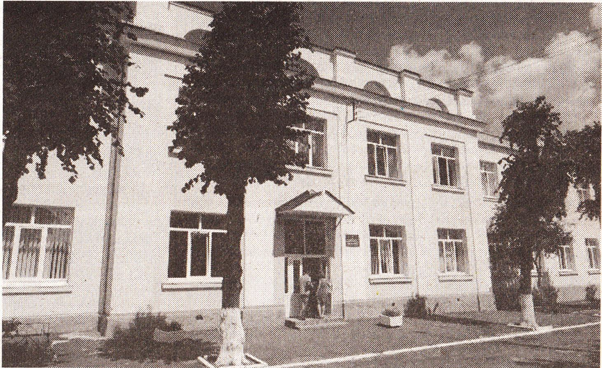
Окраса рівненської "Америки" — невеликий ошатний будинок загальноосвітньої школи №3